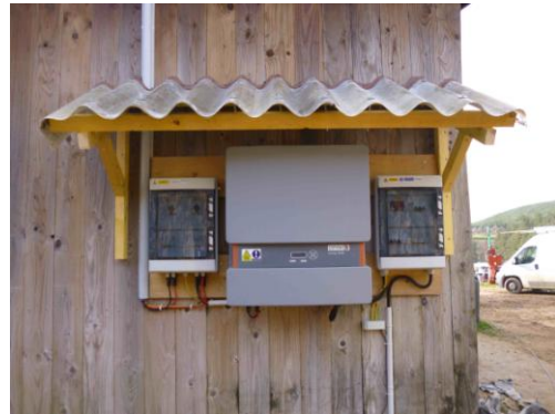
Un onduleur ardéchois CEFEM

Malgré la surface importante du toit de ce bâtiment d'élevage, nous n'avons pu implanter qu'une centrale de 9 kWc, le réseau électrique local ne permettant pas d'injecter une puissance supérieure sans investissements coûteux.