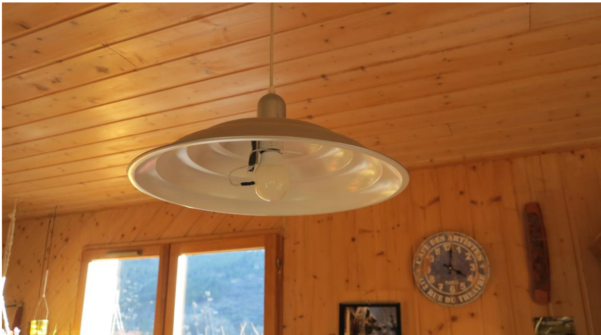
Une sonde enregistreuse discrète sur une ampoule LED

Connaître ses usages pour mieux maîtriser l'énergie. Les résultats vont permettre également à l'association Polénergie de mûrir ses conseils au grand public pour économiser l'électricité domestique. Avec les foyers volontaires, Polénergie proposera des temps d'échanges pour penser et imaginer collectivement des solutions concrètes pour réduire les dépenses, et suivre les résultats. Pour Aurance Energies, cette initiative est l'occasion de s'intéresser au thème de la maîtrise de l'énergie, et d'étudier des pistes innovantes d'investissement à l'avenir.