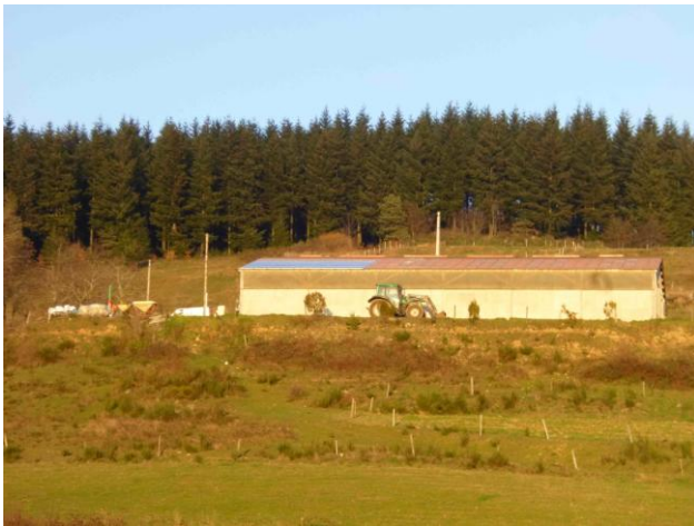
36 panneaux isérois Photowatt de 250 Wc